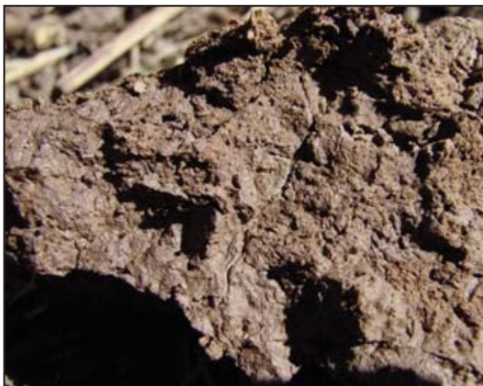
Figura 2: Cutanes (superficie con brillo) presentes en un horizonte argílico

indica por la presencia de moteados o colores grises, cromas más fuertes o hues más rojos o contenidos de arcilla más altos que el material subyacente o por la remoción de carbonatos. El horizonte cámbico no reúne los requerimientos de un horizonte argílico, kándico, óxico o espódico, ni tiene cementaciones, endurecimientos o consistencia frágil (brittle), en húmedo. El límite inferior de un horizonte cámbico debe encontrarse a 25 cm o más de la superficie.